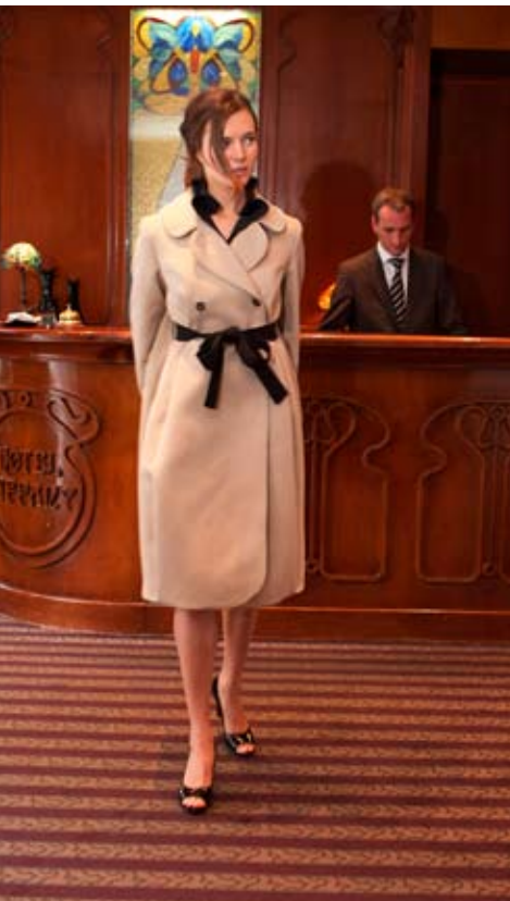
Collection Aéthérée, lauréate de Lily 2010.