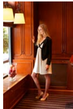
Collection Aleksandra Wisniewska.