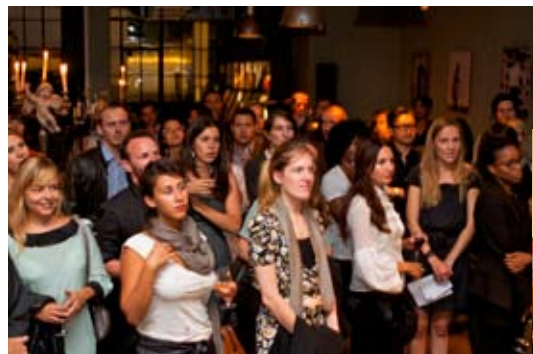
Intense suspense pour la remise du prix Lily, vendredi soir.