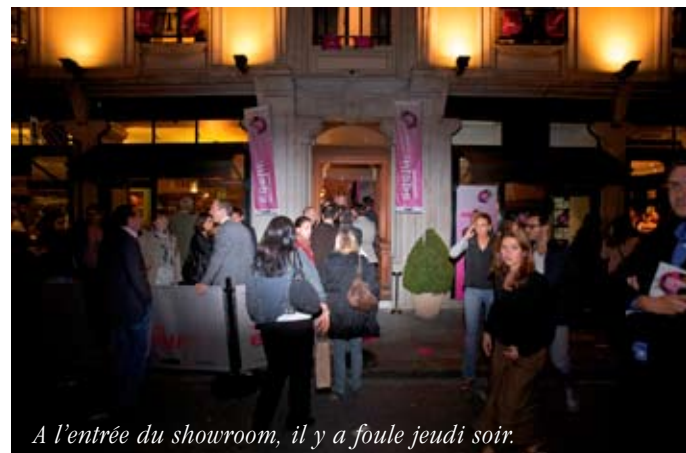
A l'entrée du showroom, il y a foule jeudi soir.