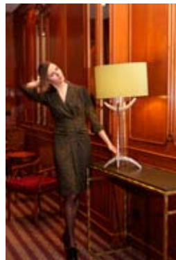
Collection Van Bery.