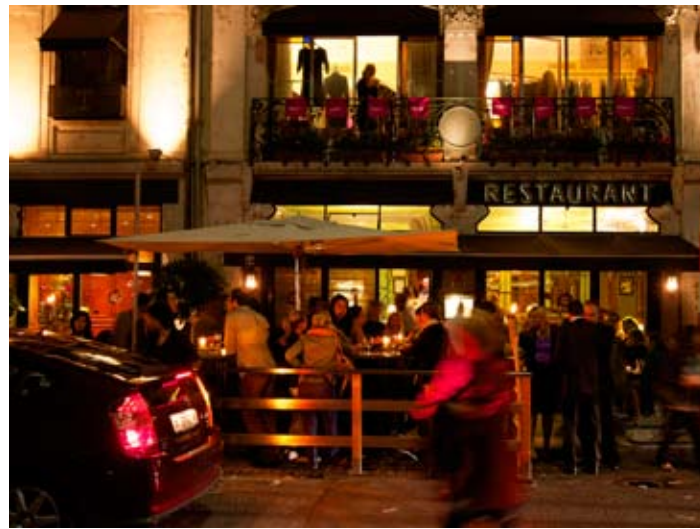
L'Hôtel Tiffany, son restaurant, sa terrasse, ainsi que quatre étages et 24 chambres dédiées aux créateurs.

Lors du showroom edelweiss, du 16 au 19 septembre dernier, la création helvète était à la fête. Avec, pour apothéose, la remise du prix Lily, né d'une collaboration entre L'Oréal Paris et edelweiss. Cette récompense de 10'000 fr. vient consacrer le travail du meilleur créateur suisse.